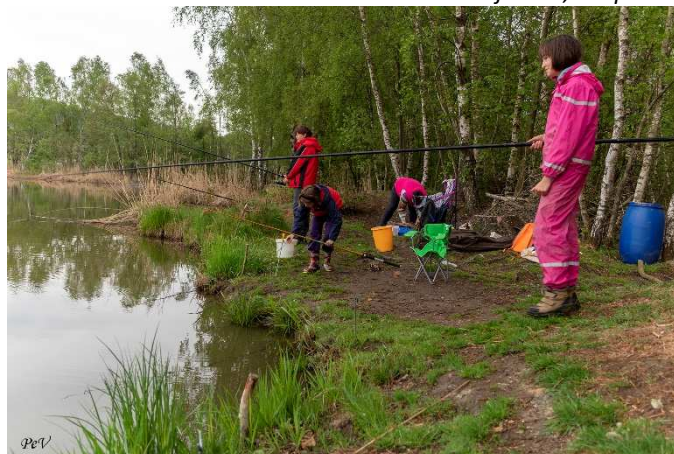
Rybářky závodnice v akci.