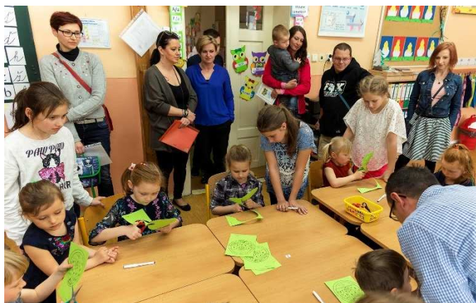
Příprava koleček pro sbírání razítek (nejen) pod dohledem žáků ZŠ.

Na bezproblémovém průběhu zápisu se podílel celý tým základní školy i někteří žáci ZŠ. PeV