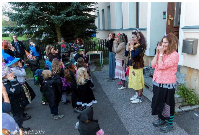
Čarodějnické tanečky jsou velmi oblíbené