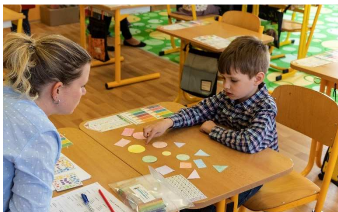
Poznávání barev a tvarů.