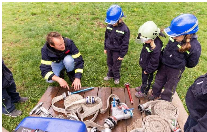
Mladší pozorně poslouchají svého velitele.