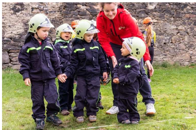
Taktická porada našich Proudniček před startem.

Děkujeme za spolupráci od rodičů s odvozem dětí na soutěže a našim řidičům z JSDH Rybniště. MV