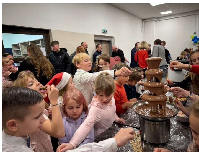
Čokoládové mámení zachytil H. Vojtěch.