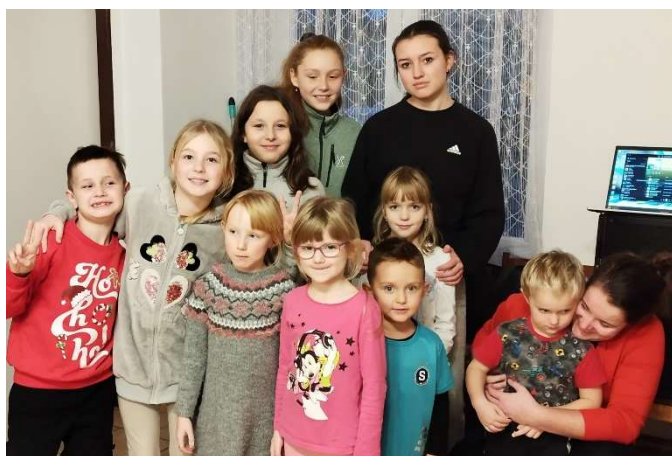
V lednu začínáme novoročními hrátkami v bazénu. MV