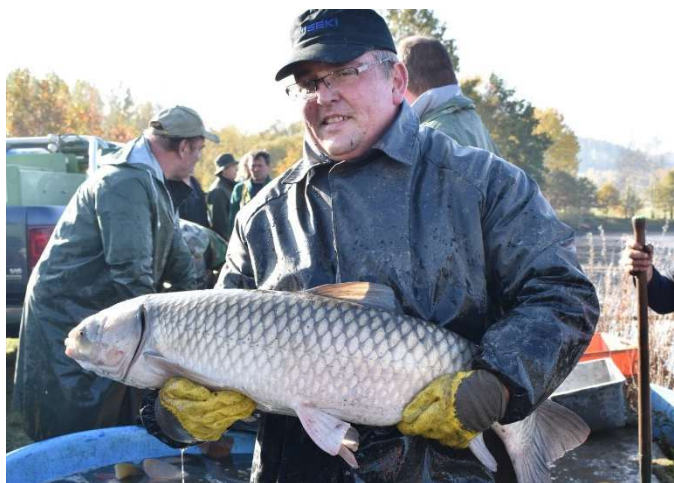
Rybáři měli s rozměrnými rybami dost práce.

Kdo by měl zájem se o situaci na Velkém rybníku dočíst více, necht' otevře si zářijové vydání zpravodaje PERMONÍK, kde jsou podrobné informace od starosty obce Horní Podluží: https://www.hornipodluzi.cz/permonik-rocnik-2024