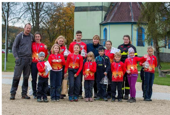
Naši soptíci v nových dresech se zlatými medailemi – radost byla veliká.