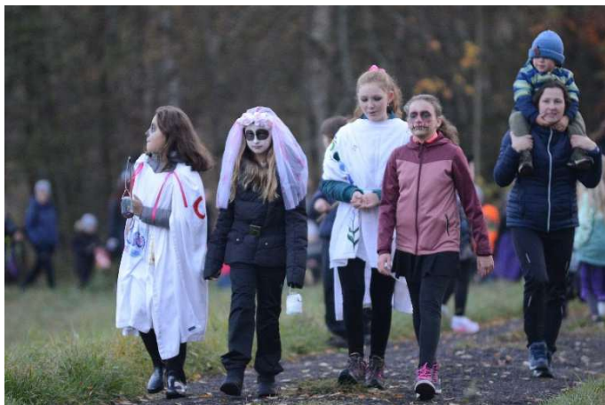
Početný průvod masek a jejich doprovodu.