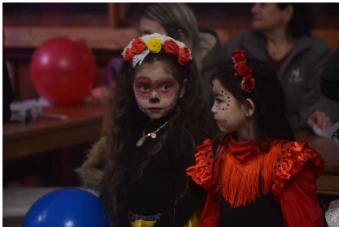
Některé masky jako by přímo vypadly z pohádkového příběhu COCO

Další fotky od K. Dvořáčka jsou k prohlédnutí na veřejném albu uživatele kachna011 na RAJCE.NET.