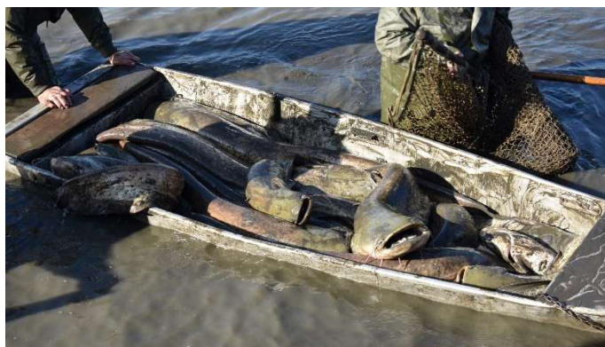
Kapitální úlovky sumců.