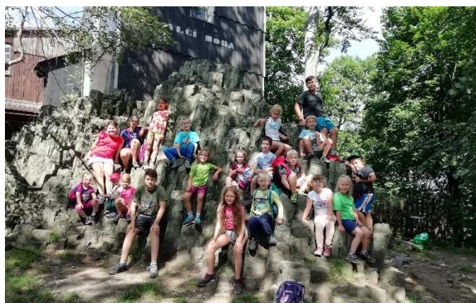
Výlety... tady pod rozhlednou na Vlčí Hoře.