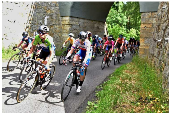
Průjezd závodnic při 4. etapě pod železničním mostem v Rybníšti na Horní Chřibskou.