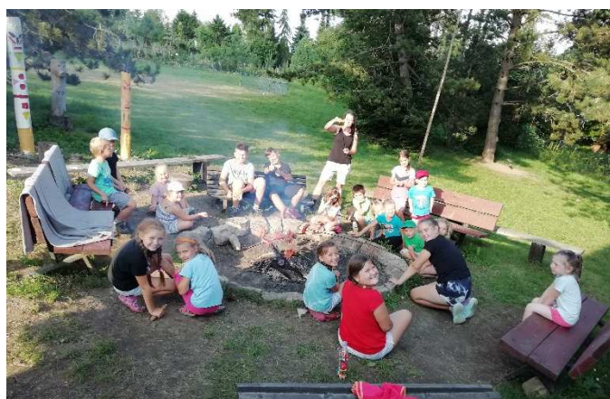
Pohoda u ohně.