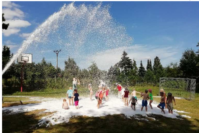
Zábava v bílé pěně.