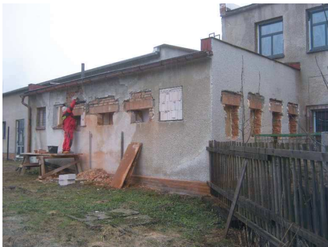
Osazování překladů nad novými okny a dveřmi na toaletách.