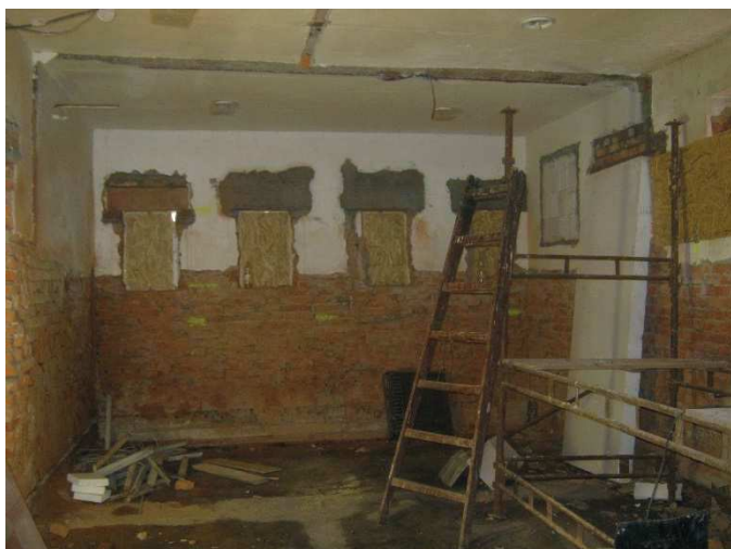
Vybouraná vnitřní dispozice toalet.