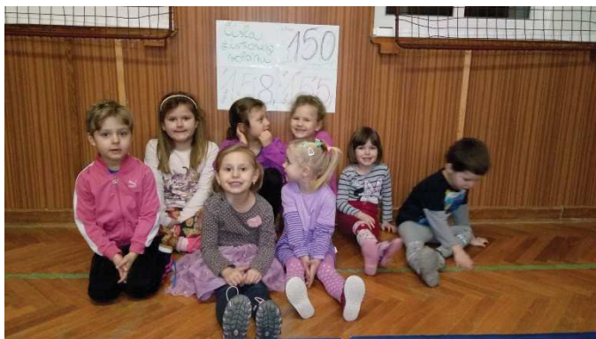
Šikovní malí soptíci by svoji tělocvičnu shořet nenechali ☺

V pátek 19. 1. jsme se s nejmenšími Soptíky naučili čísla tísňového volání - ke každému jsem použila nějakou pomůcku, aby si to děti lépe pamatovaly. Každý si obdržel svou barvou číslo na hasiče a poté svým podpisem stvrdil, že si to bude pamatovat. Poté následovala ta těžší část, kdy děti zkušebně volaly na hasiče s oznámením, že hoří v tělocvičně ve škole v Rybníšti. Za mě pro všechny děti obrovská pochvala, mám z vás radost! IV