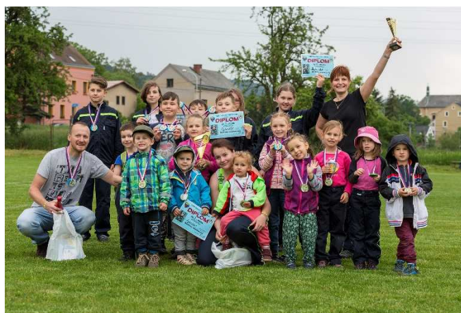
Bylo mnoho důvodů k radosti a úsměvům!

Rybníšťský (pod) Vodník – měsíčník Obecního úřadu v Rybníšti