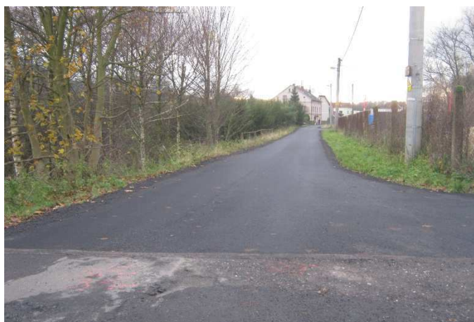
Pohled z křižovatky ke stavebninám.

Druhá oprava proběhla na části komunikace před uhelnými sklady směrem ke stavebninám a byla financována z rozpočtu obce. Celkové náklady činily přes 286 tis. Kč.