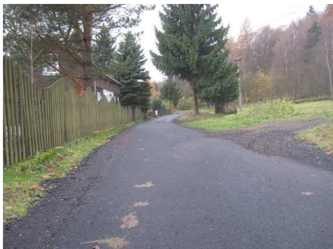
Opravený úsek nad nádražím – směrem k „Hangáru“.

Stavební práce prováděla firma DOKOM FINAL Děčín a byly dokončeny dnem 13.11.2017.