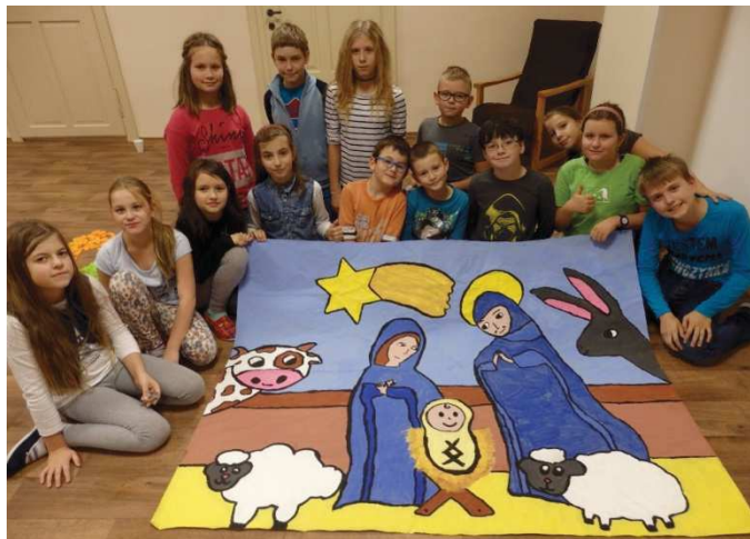
Autoři betlému... moc se jim povedl!