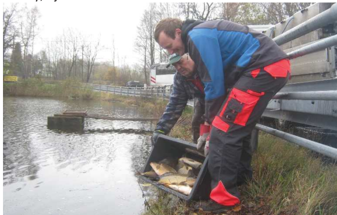
Kapříci byli pečlivě zváženi a spočítáni.

Sportovní rybolov na Školním rybníku skončil dnem 30.11.2017. Pro sezónu 2018 byly koncem listopadu přivezeny nové ryby. Aktuální rybářský řád pro rok 2018 a ceník povolenek bude zveřejněn před zahájením nové sezóny, t.j. 1. dubna 2018.