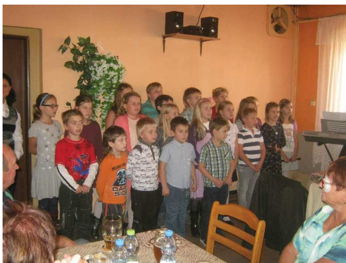
Děti ze základní školy. Byly opět úžasné!