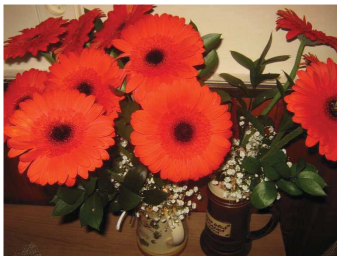
Nádherné červené gerbery udělaly radost každému.