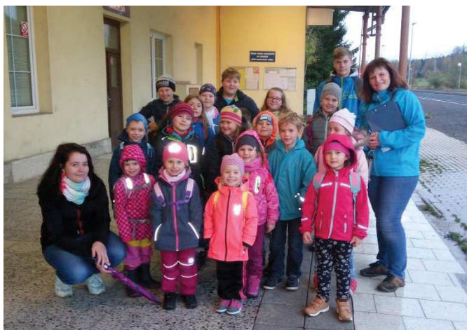
S úsměvem na nádraží v Rybníšti...