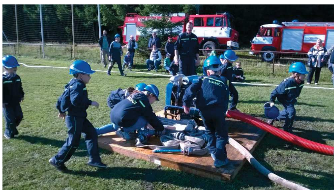
Proudničky v akci...