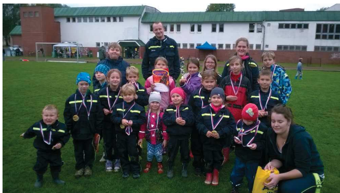
Úsměvy na tvářích po skvělých výkonech.

Třetí ročník hasičské soutěže v požárních útocích „ O pohár starosty obce Rybníště “ se konal v sobotu 30. 9. dopoledne na místním fotbalovém hřišti. Sluníčko nám letos přálo a příjemně hrálo. Letos k nám přijelo 5 sborů (Rumburk, Varnsdorf, Šluknov, Velký Šenov a Království). Proudničky si odnesly zlaté medaile , mladší byli tentokrát „bramboroví“. Starším se útoky moc nevyvedly, i přesto jejich výkony oceňujeme. Všechna družstva si odnesla dárkové tašky a společně jsme prožili příjemné dopoledne bez úrazů.