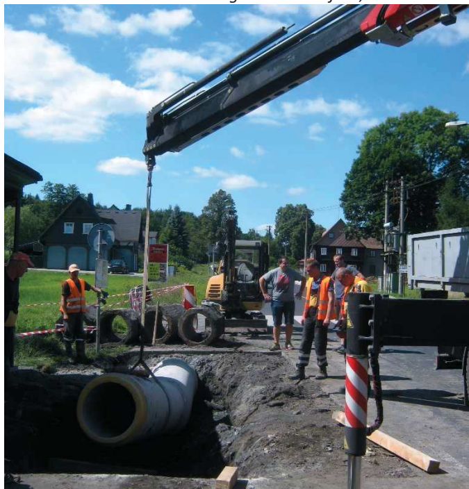
Pokládka nových betonových trubek u zastávky vedle pošty