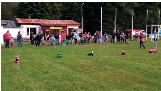
Dětské motorky čekají na své závodníky