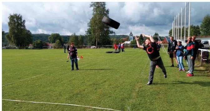
Vzduchem létaly i pneumatiky