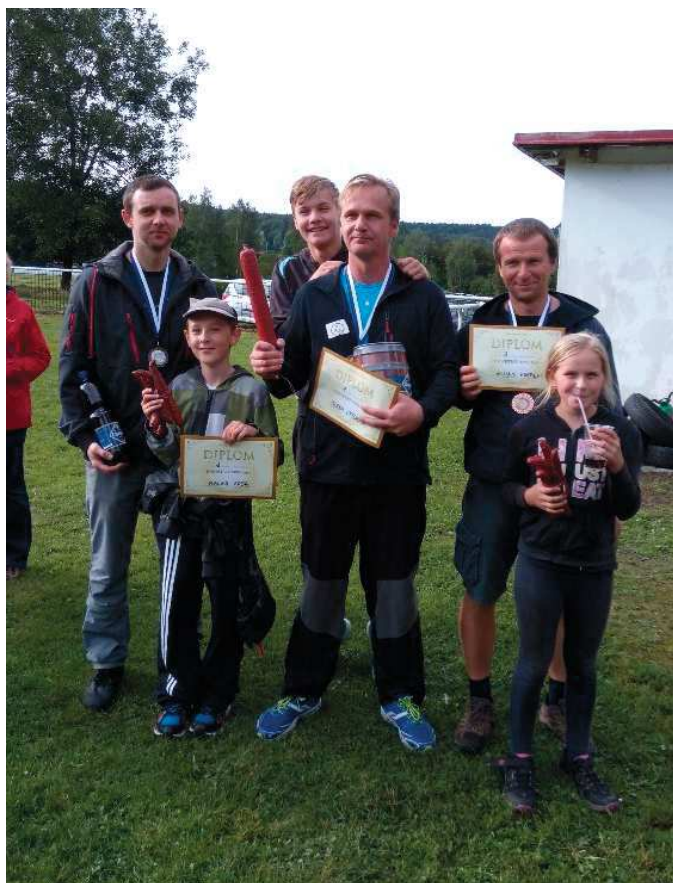
Letošní vítězní Bivojové