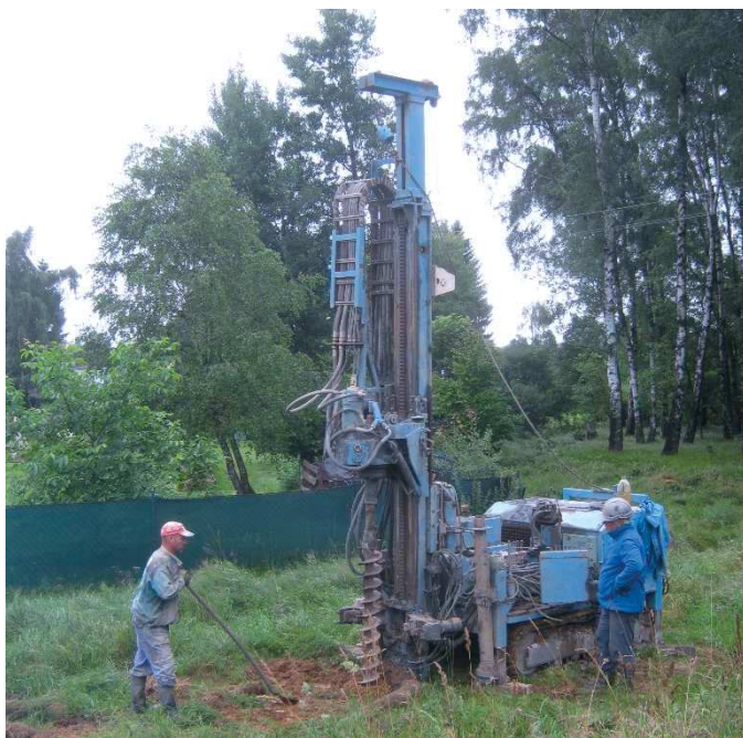
Vrtání studny u fotbalového hřiště

Rybnišťský (pod) Vodník – měsíčník Obecního úřadu v Rybništi