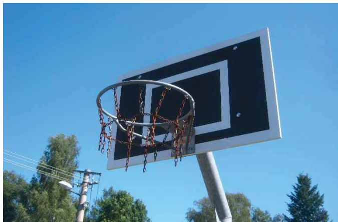
Opravený koš v obrácených barvách je na svém místě