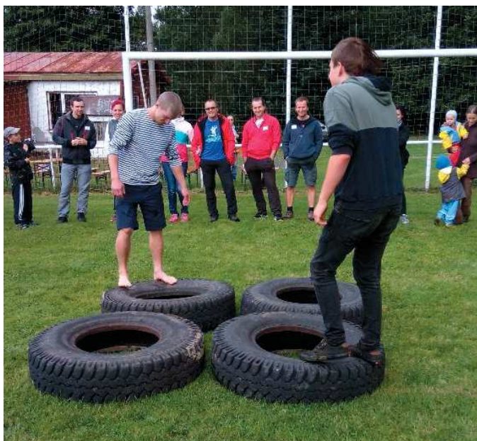
Příprava na boj