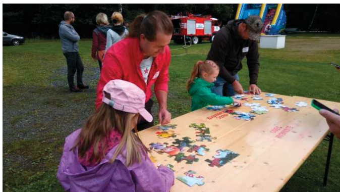
Skládání puzzlů prověřilo malé i velké