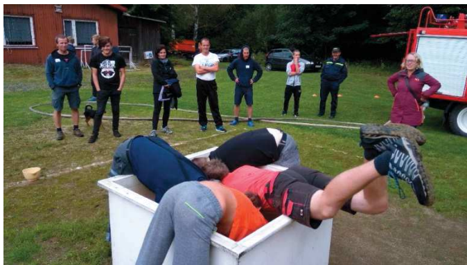
Někteří Bivojové šli na lov „rybiček“ opravdu po hlavě