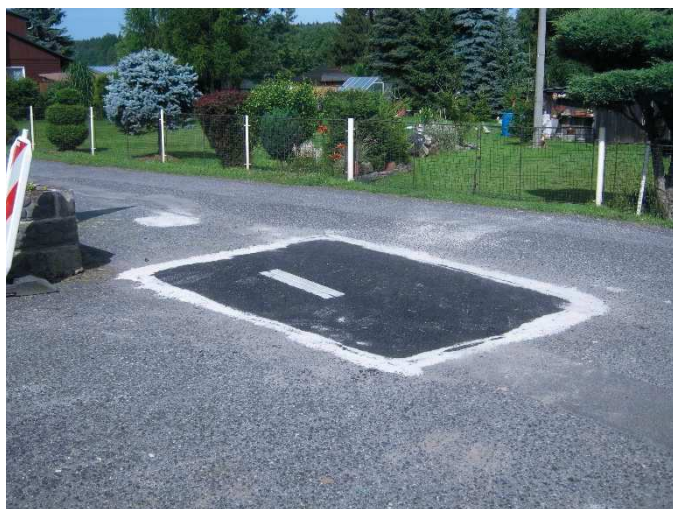
Výměna štěrbiny za vpust u samoobsluhy