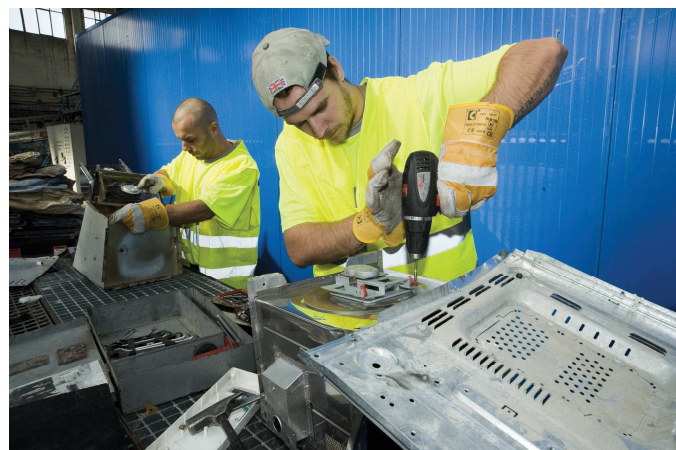
Ilustrační foto: Ruční demontáž malých elektrospotřebičů.