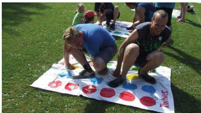
Zamotané ruce nohy... bivojové na twistru.