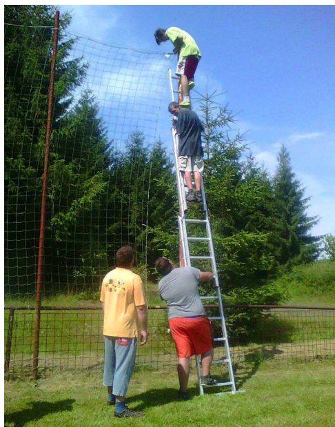
Jak je vidět - při nátěru byli i odvážlivci ve výšce

S konečnou platností jsme zaregistrováni z občanského sdružení jako TJ Tatra Rybníště, z.s. (zapsaný spolek), který má tři oddíly: fotbalový oddíl, oddíl kulečnickářů a oddíl rekreačního sportu. Celkem má TJ Tatra 54 členů. Neaktivnějším oddílem je momentálně oddíl fotbalový. Po skončení fotbalové sezóny ročníku podzim 2015 – jaro 2016 se v celkové tabulce umístili na druhém místě a postoupili tak ze třetí třídy do vyšší třídy - okresního přeboru. Že to myslí fotbalisté reprezentující naši obec vážně, začali brigádou úprav na hřišti. V sobotu 23.7.2016 se sešlo celkem 11 členů. Věnovali se nátěru fotbalových branek a oplocení v době od 10,00 hodin do 14,00 hodin. Vše se nestihlo a tak byla domluvena další brigáda.