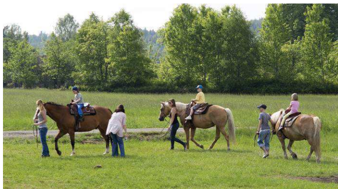
V sedle... oblíbené vyjížděky na koních. Další fotky si prohlédněte na webu obce!