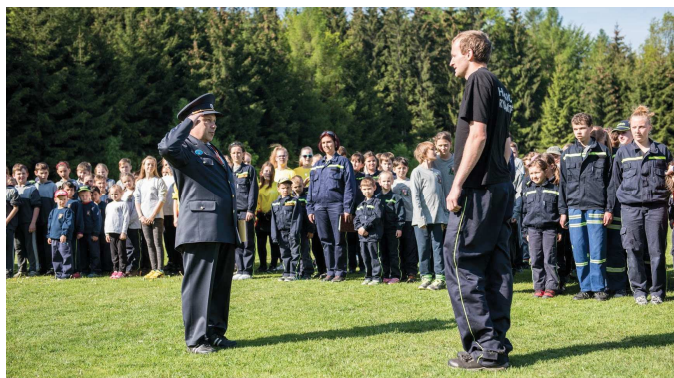
Sbory nastoupeny, soutěž zahájena...