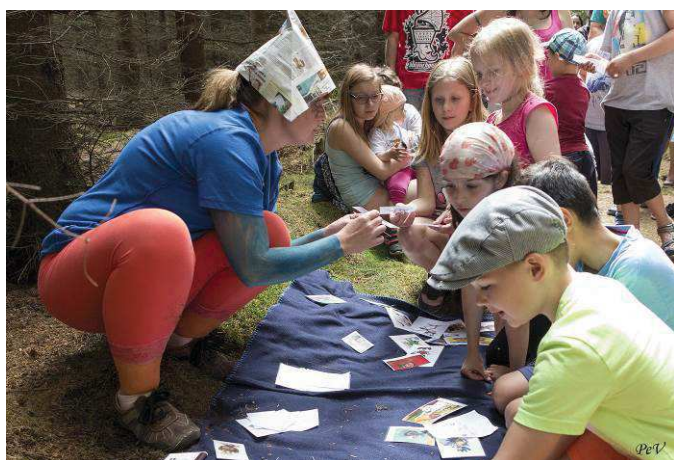
Tvoření pohádkových dvojic u večerníčka.

Na každém stanovišti dostaly razítko a v cíli jim Marfuša dala za odměnu balíček a poukázku na limonádu. Děti se mohly svést na konících a nechat si namalovat něco hezkého na tělo. Celkem náš pohádkový les navštívilo neuvěřitelných 101 dětí . Společným hlasováním zvolily nejhezčí stanoviště - ježibabu z perníkové chaloupky. Akce se podle reakcí lidí povedla, děti byly nadšené a počasí stálo při nás.