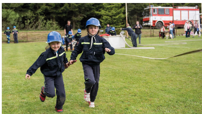
Holky v akci.