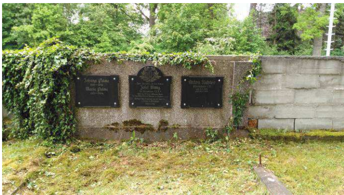
Oprava kenotafu na místním hřbitově.