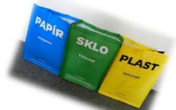
Tašky na tříděný odpad do domácnosti k dostání na OÚ