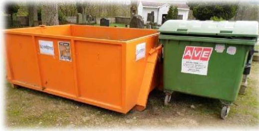
Zelený kontejner na místním hřbitově + oranžový na bioodpad