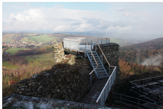
Nová vyhlídka na Tolštejně.

Josef Zoser, Jiřetín pod Jedlovou; redakčně zkráceno