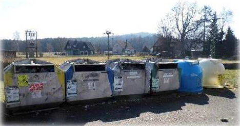
Kontejnery u samoobsluhy