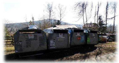
Kontejnery u „Hangáru“