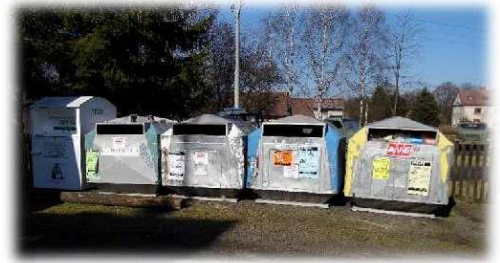
Kontejnery u obecního úřadu