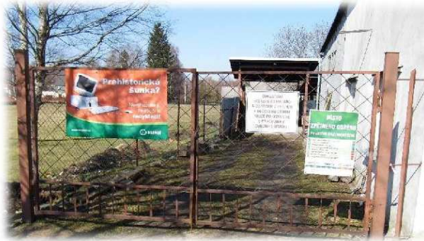
Sběrový dvůr u OÚ