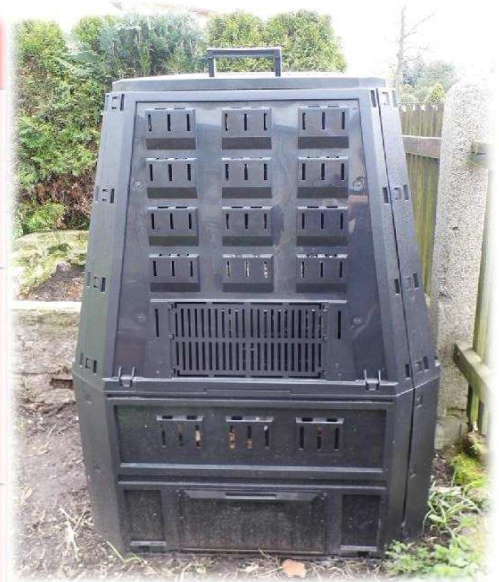
Kompostér na bioodpad k vyzvednutí na obecním úřadu zdarma