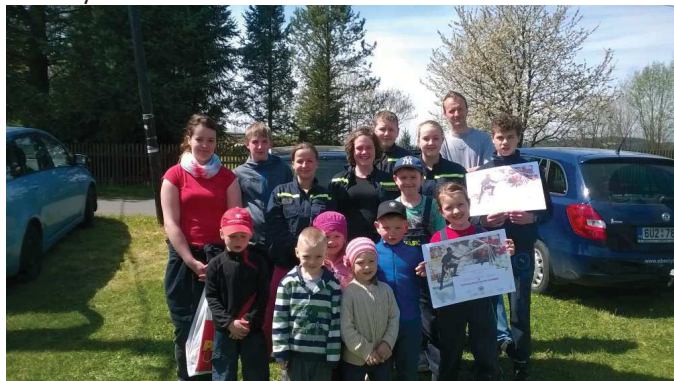
Soptíci na soutěži.