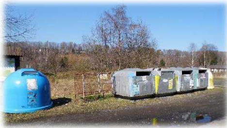
Kontejnery v Nové Chříbské