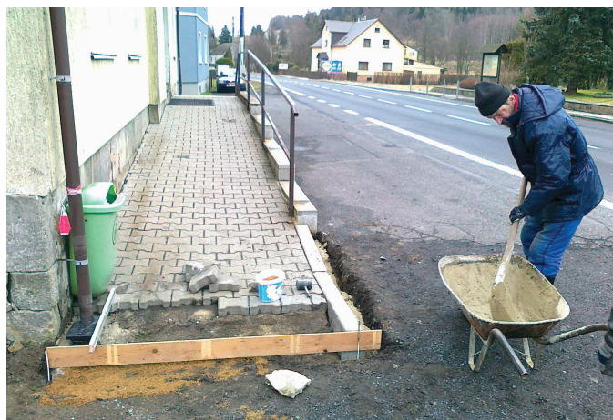
Provádění úprav přístupového chodníku k obecnímu úřadu.