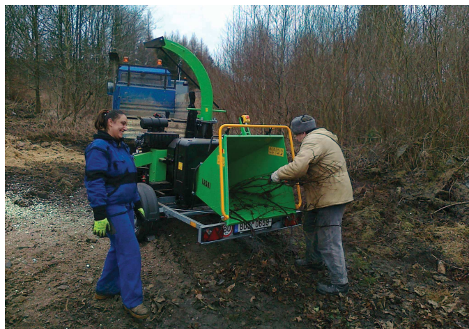
Nový štěpkovač v akci.