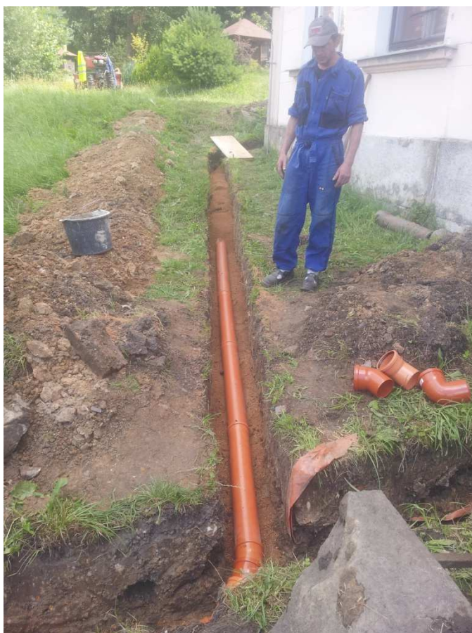
Realizace nových dešťových svodů u č.p. 97, Nová Chřibská.