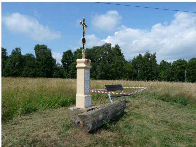
Instalace lavičky u křížku nad p. Vanžurou.