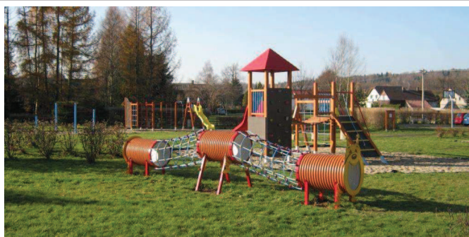
Snad nejoblíbenější investice z dotací je naše dětské hřiště – 2012.