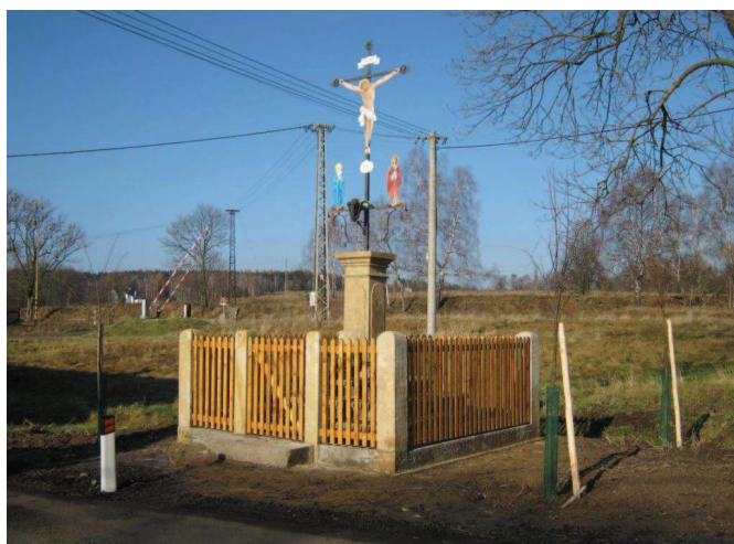
Křížek u paní Kolářové (a další 3) vypadá jak nový – dotace 2012.