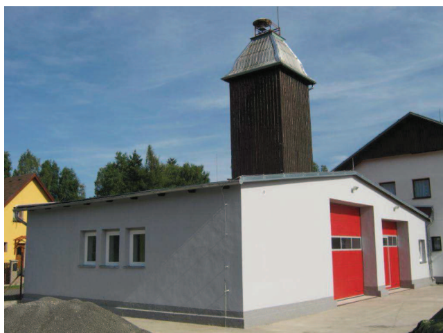
Rekonstrukce hasičské zbrojnice z dotace z let 2012/2013.