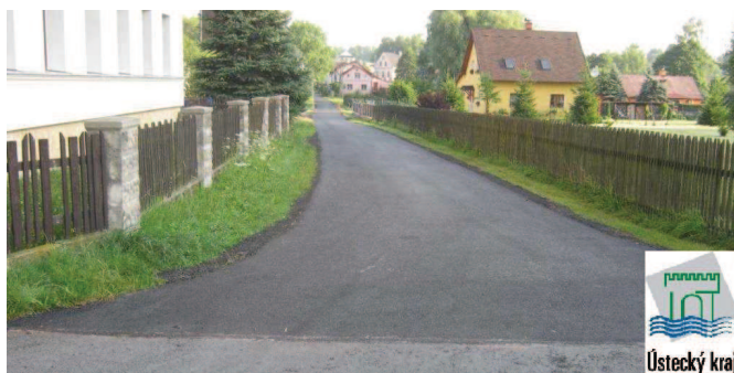
Nový povrch komunikace kolem hasičské zbrojnice – dotace 2014.