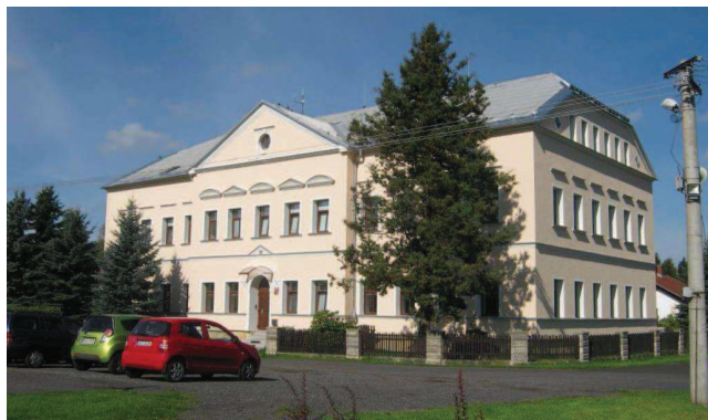
Největší investicí z dotací bylo zateplení naší ZŠ 2013/2014