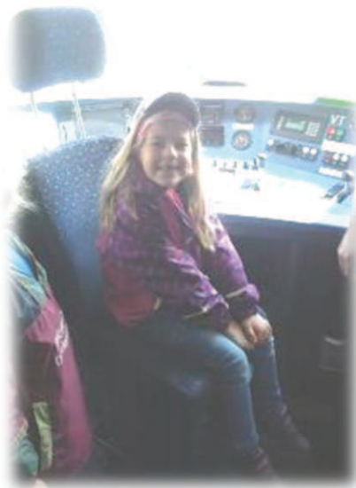
Prohlídka osobního vlaku.