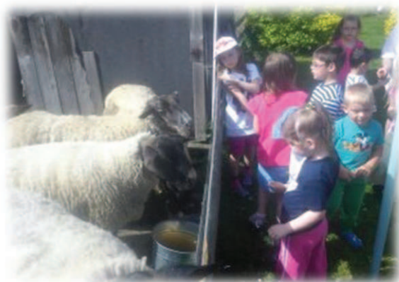
Krmení oveček u Forferů.