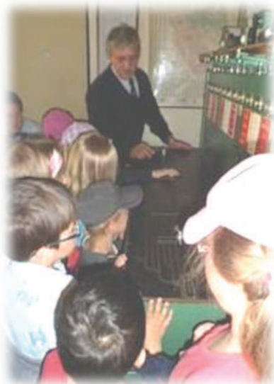
Exkurze na místním vlakovém nádraží.