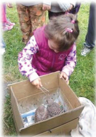
Krmení mláďat dravců.