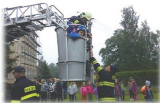
Návštěva hasičského sboru z Varnsdorfu.