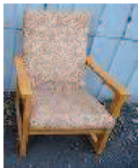
židlička dětská za 10,- Kč/ks křeslo velké za 50,- Kč/ks