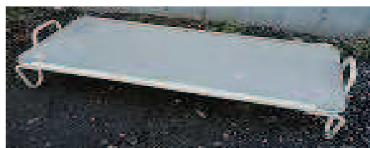
lehátko dětské za 20,- Kč/ks

Bližší informace na obecním úřadu pouze v pracovní dny !!!